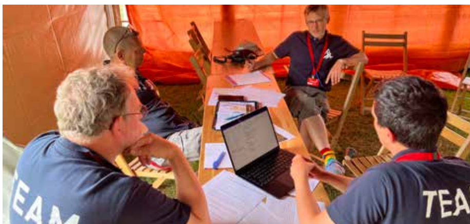
Wie viel weiß der Vorstand der Zeltlager AG? Hier während einer Krisensitzung.

Auffällig ist, dass in den Fachbereichen Programm und Verpflegung offenbar kein Personal- oder Fachkräftemangel besteht. Recherchen zeigen jedoch, dass auch hier der Schein nur noch mit großen Anstrengungen aufrechterhalten werden kann. Ob dem Vorstand der Zeltlager Unternehmung die Fehlentwicklungen bekannt sind, war nicht herauszufinden. Jedoch trafen sich die Kopfgesteuerten offenbar zu einer Krisensitzung unter Beteiligung des Sicherheitsbeauftragten. Aus gut informierten Kreisen hieß es danach, dass man sich auf verschiedene Szenarien vorbereite.