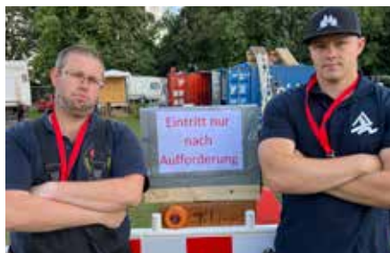
Herzlicher Empfang für neue Bauhofkollegen

Ähnlich prekär sieht es beim Bauhof aus. So waren gestern Mitarbeiter zu beobachten, die auf einem grünen Gefährt mit Anhänger auf dem Zeltlagergelände verzweifelt nach neuen Kollegen suchten. Zudem ist auffällig, dass die Bauhofler mittels Teleskopstapler regelmäßig in die Luft gehen, um nach Nachwuchs Ausschau zu halten.