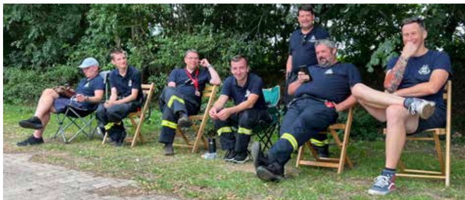
Am Ende: Fahrdienst klagt über massiven Fachkräftemangel und schmutzige Fahrzeuge.