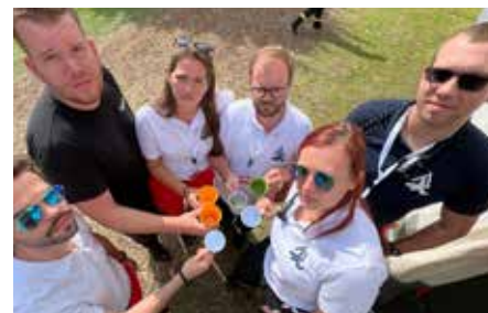
Leere Becher, schlechte Stimmung bei Sanis.

Auch im Fahrdienst spitzt sich die Lage immer weiter zu. Aus dem Umfeld des Fachbereichs ist zu hören, dass die Kutscher manchmal mit schmutzigen Autos unterwegs sein müssen, weil sie niemand reinigt. Zudem fehlen Fachkräfte im Bereich Freizeitdisposition, die die wenige freie Zeit effizient planen und organisieren.