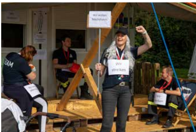
Rumlungern und pöbeln statt zu arbeiten.

Jeder Verwaltungsangestellte soll täglich einen kostenlosen Milchshake erhalten. Ab einer Arbeitszeit von 5 Stunden wird je einen weiterer Milchshake gefordert. Unerwartet hat sich auch das Programmteam dem Streik angeschlossen und sich mit den fordernden Verwaltungsmitarbeitern solidarisiert.