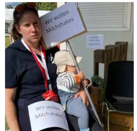
Selbst die Kleinsten werden für den Streik instrumentalisiert.

Der Ausgang dieses Streiks bleibt abzuwarten, doch er hat bereits jetzt die Bedeutung der Arbeitsbedingungen und der Mitarbeiterwertschätzung in den Fokus gerückt. Die Aktion des Verwaltungsteams hat deutlich gemacht, dass es an der Zeit ist, die Herausforderungen in der Verwaltung anzugehen und für eine gesunde Arbeitsumgebung für alle Angestellten zu sorgen.