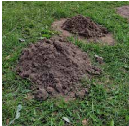
Soll Spuren des Maulwurfs zeigen.

Offenbar gibt es einen Maulwurf im O-Team, der Fallen stellt, Interna ausplaudert und Spionage in den Fachbereichen betreibt. Aus Managementkreisen ist zu hören, dass man dem Störenfried auf der Spur ist, jedoch noch keine klaren Anhaltspunkte, wer er ist und welche Informationen er bereits abgegriffen und weitergegeben hat. Es ist auch nicht auszuschließen, dass er durch die bewusste Weitergabe von Informationen die Fachbereiche gegeneinander aufbringen will. Mal schauen, ob der Maulwurf im nächsten Zeltlager enttarnt werden kann.